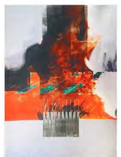
Dan Reisinger - Israël