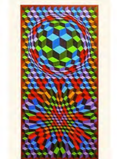
Victor Vasarely - Hongrie - France

3000 illustrations, 1660 sérigraphies originales, 530 posters d'art... Michel Caza fait partie des figures mondiales du monde de sérigraphie.