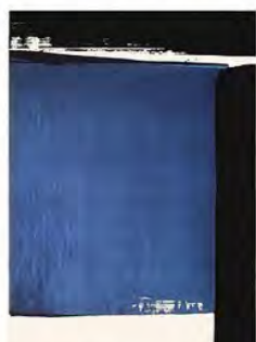
Pierre Soulages - France