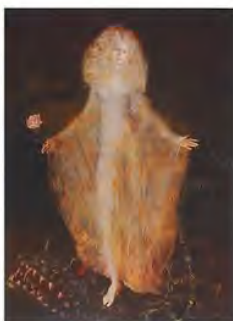
Leonor Fini - France