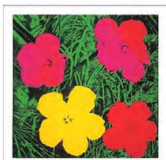
Andy Warhol - USA

C!PRINT 2019 MET LE PRINT DANS TOUS SES ÉTATS