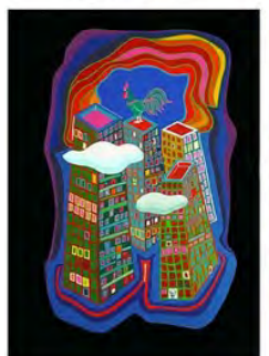
Friedensreich Hundertwasser - Autriche