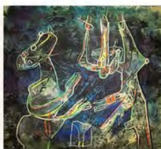
Roberto Matta - Chili