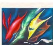
Tarō Okamoto - Japon