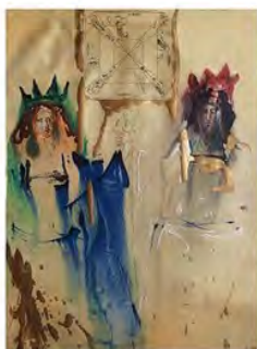
Salvador Dalí - Espagne